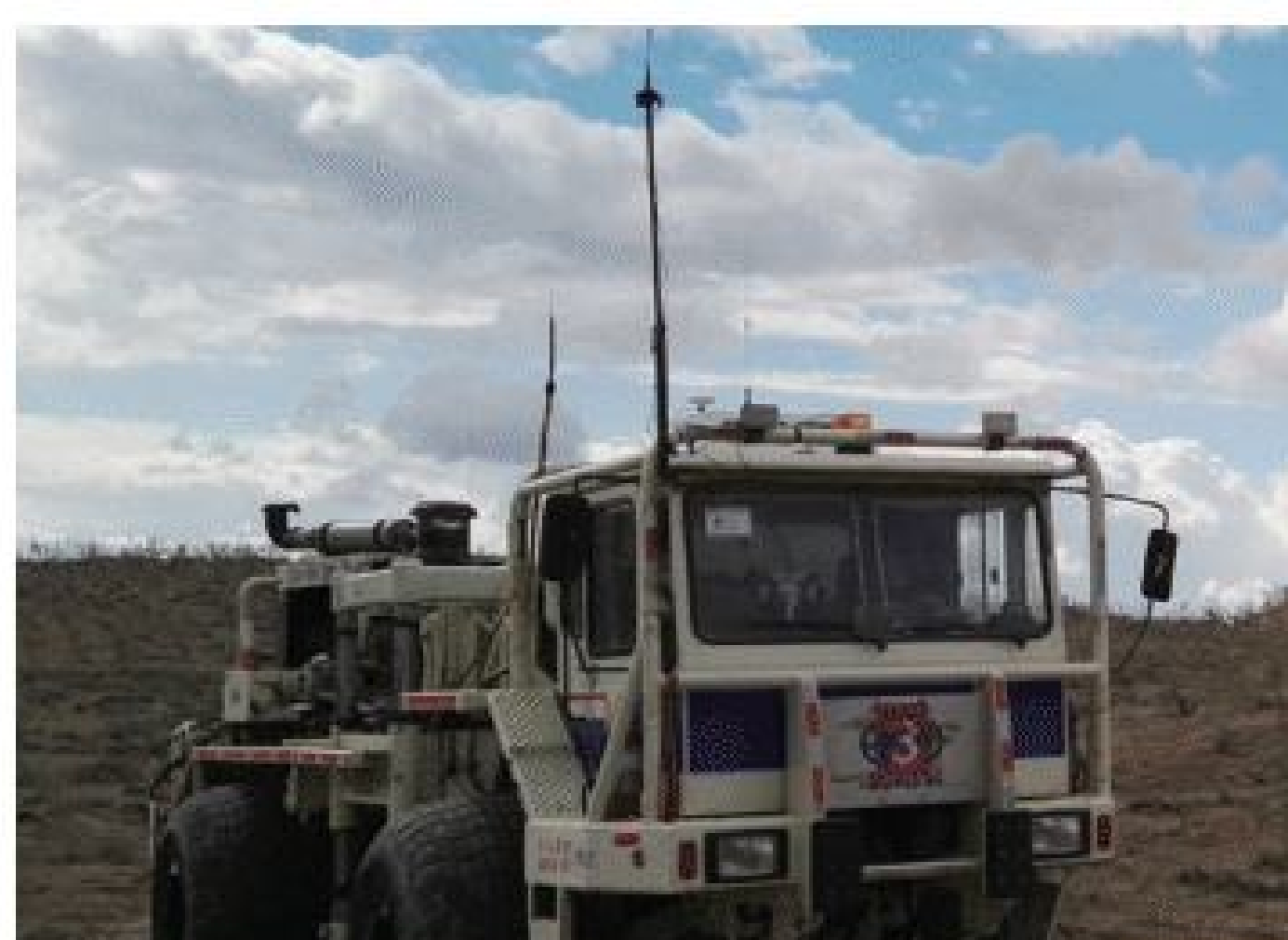
Работы на открытом воздухе

Аксессуары могут быть выбраны в соответствии с требованиями применения в различных отраслях промышленности.