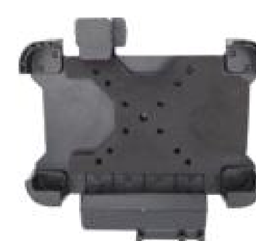
Крепление на транспортном средстве