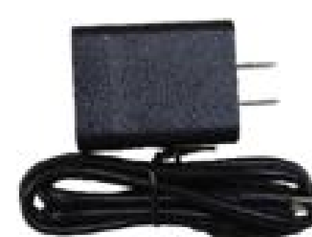
Адаптер для быстрой зарядки