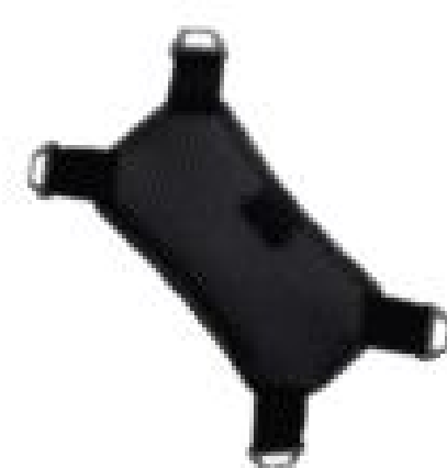
Ремешок для рук